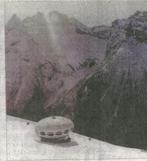
Dombassa Venäjän Kaukasuksella alkuperäinen Futuro on yhä käytössä hihtomajana.