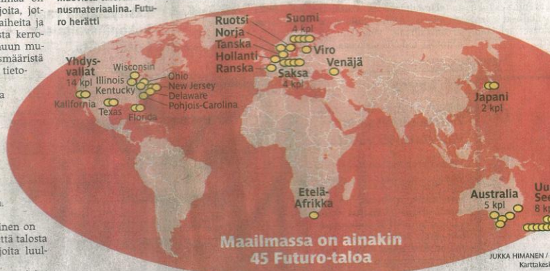
JUKKA HIMANEN / H Karttateksti