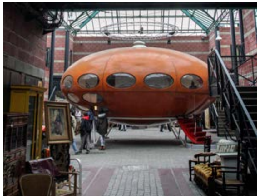
Här i antikhallarna Marche Dauphin står ett välbehållet Futuro på paradplats.