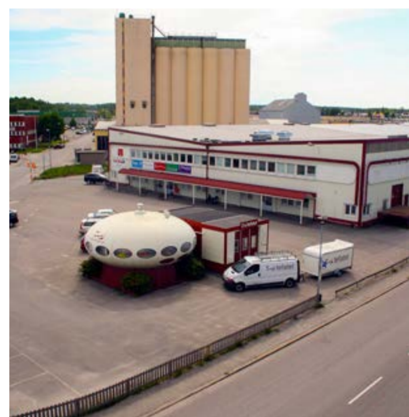
Det ska finnas fyra Futuro i Sverige. Försvarsmakten satte två här och ett vid flygflottiljen Sätenäs. I Örebro är "Tefatet" välkänt. Det används som kontor.