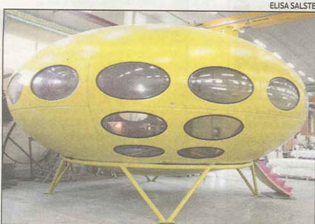
Tämän Virtasalmella kunnostetun Futuron sarjanumero on 1.