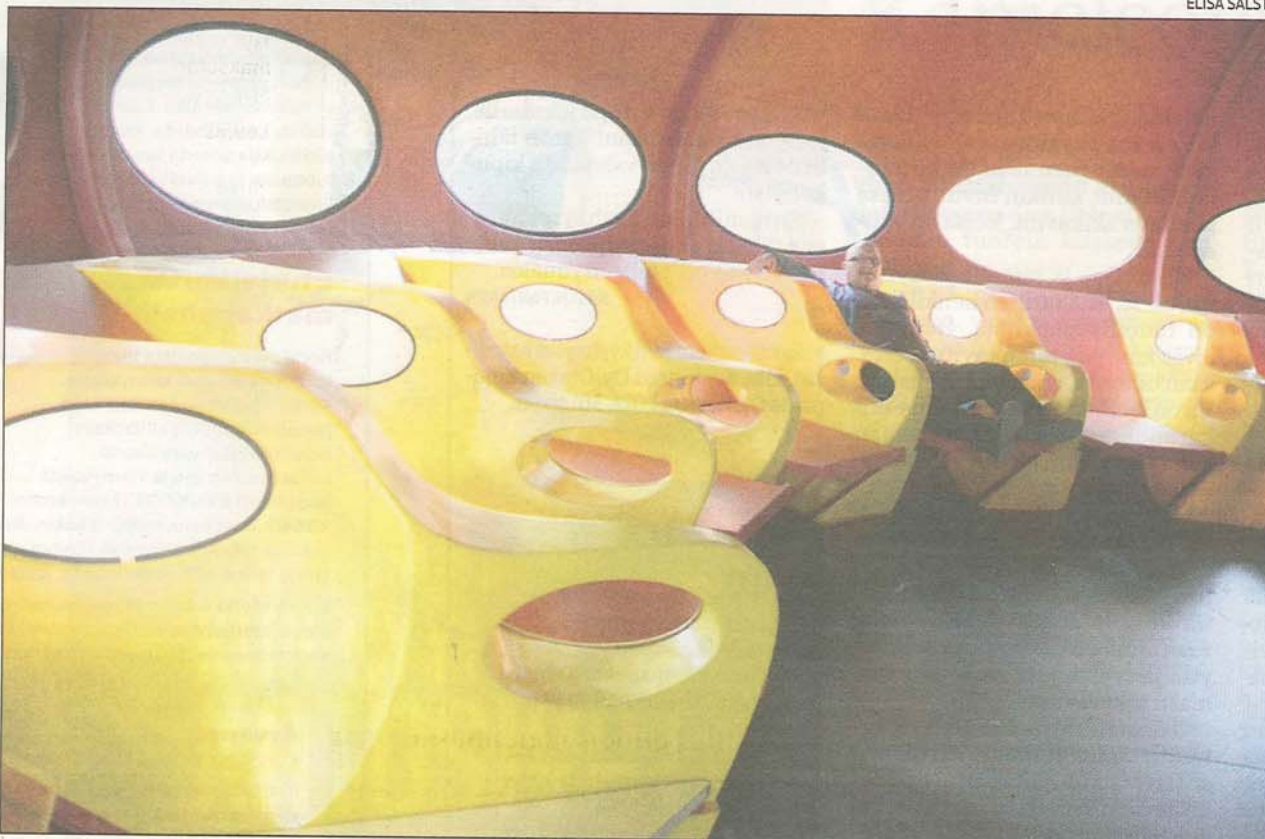
Yrittäjä Erkki Lappi kunnosti Futuron myös sisältä. Erikoista siinä on muun muassa vuoteeksi avautuvat tuolit. Viime kesänä kunnostettu Futuro matkasi WeeGee-messukeskukseen.