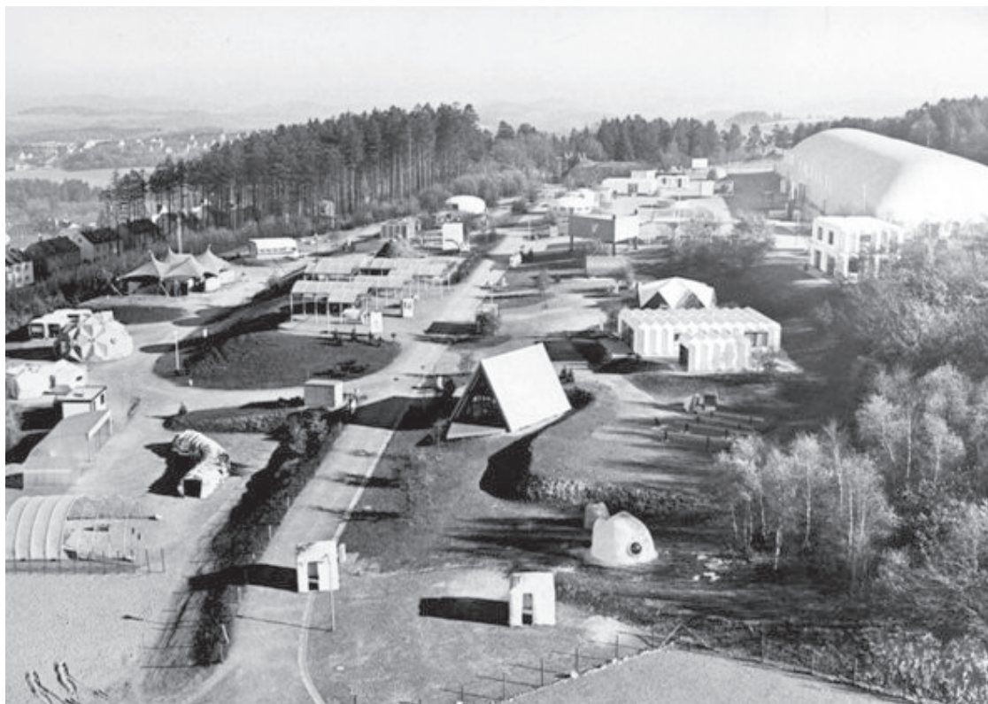
Abb. 2) Blick nach Osten über das Ika-Gelände 1971 vor der Eröffnung. Rechts im Hintergrund die Traglufthalle.

Solche und andere Stahlkonstruktionen gehörten inzwischen zu den eher konventionellen Bauweisen. In der innovativen und experimentellen Architektur bemühten sich die Protagonisten nicht nur um neue konstruktive Verfahren, sondern auch um den Einsatz neuer Baustoffe. Dabei spielten die Kunststoffe eine exemplarische Rolle. Im Innenausbau von Gebäuden nahmen sie bereits einen wesentlichen Anteil ein. Auch bei den Möbeln fanden sie Verwendung. Warum nicht in der Tragwerkkonstruktion? Neue glasfaserverstärkte Kunststoffe auf Polyesterharz-Basis sollten dies ermöglichen. Der amerikanische Architekt R. Buckminster Fuller realisierte seit 1954 große Überdachungen auf der Basis sog. geodätischer Konstruktionen aus Kunststoff. Das erste französische Kunststoffhaus 1956 war noch eine Mischkonstruktion. Als frühestes reines Einfamilienhaus aus Kunststoff gilt das Monsanto house of the future , das 1957 im Disney-Park in Kalifornien erbaut wurde. 3