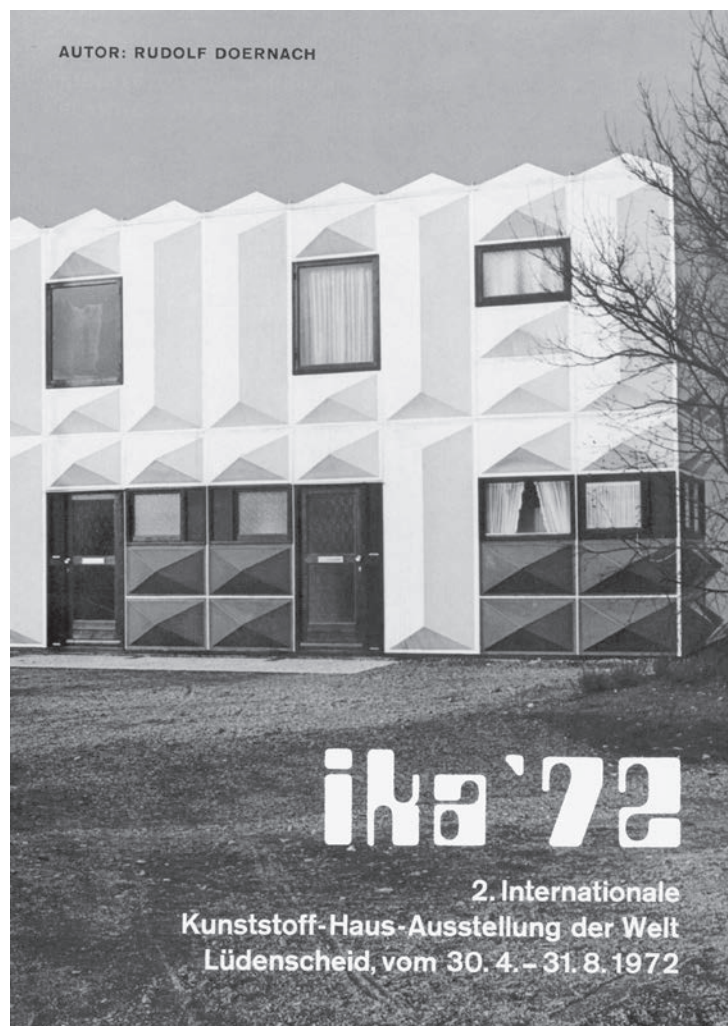
Abb. 8) Deckblatt des Katalogs zur Ika'72.

Viel gibt es über den Verlauf der Ika'72 nicht zu berichten. In der Abfolge der Ausstellungsmonate kamen noch einzelne neue Häuser hinzu. Eins davon, das gewiss interessanteste der gesamten Ausstellung, war das