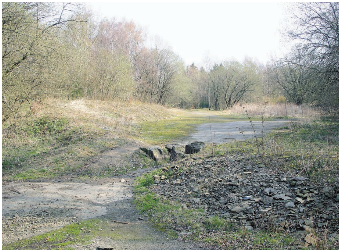
Abb. 10) Das Ika-Gelände im heutigen Zustand.

Schon Anfang 1972 machten Gerüchte die Runde, die SABAG sei in finanziellen Schwierigkeiten. Tatsächlich bat sie in den Eröffnungstagen die Stadt um eine Stundung ihrer Pachtforderungen, was aber abgeschlagen wurde. 16 In der Öffentlichkeit hielt sich die SABAG zu-