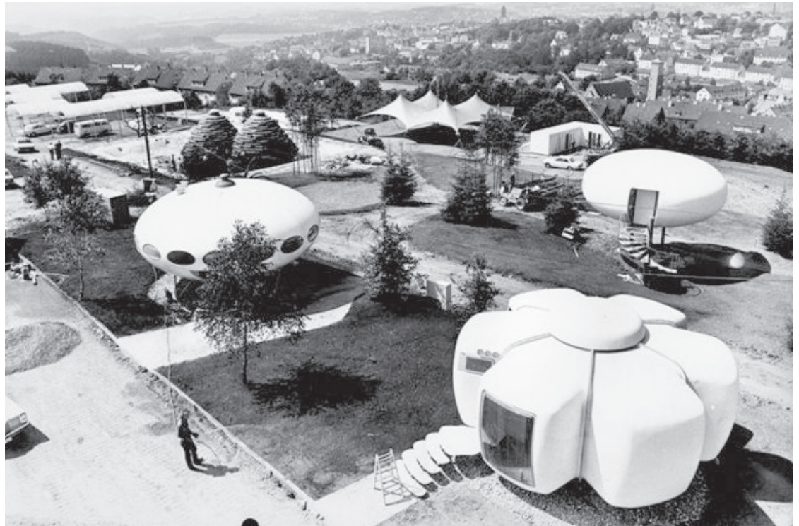
Abb. 1) Blick nach Nordwesten über das Ika-Gelände 1971 vor der Eröffnung. Rechts vorn das Orion, links davon das Futuro, rechts davon das Rondo; unmittelbar hinter dem Futuro der Biodom, rechts davon das Zeltdach für den städtischen Pavillon.

Neue Entwicklungsperspektiven ergaben sich in jenen Jahren noch aus einem anderen Grund. Am 1. Januar 1969 war das Gesetz über die kommunale Neugliederung des Kreises Altena und der kreisfreien Stadt Lüdenscheid in Kraft getreten. Lüdenscheid verlor seine 1907 erworbene Kreisfreiheit, wurde jedoch anstelle Altenas Kreisstadt des neuen Kreises Lüdenscheid. Die das Stadtgebiet ringförmig umschließende, flächenmäßig viel größere Gemeinde Lüdenscheid-Land wurde bis auf kleinere Randbereiche in die Stadt ein-