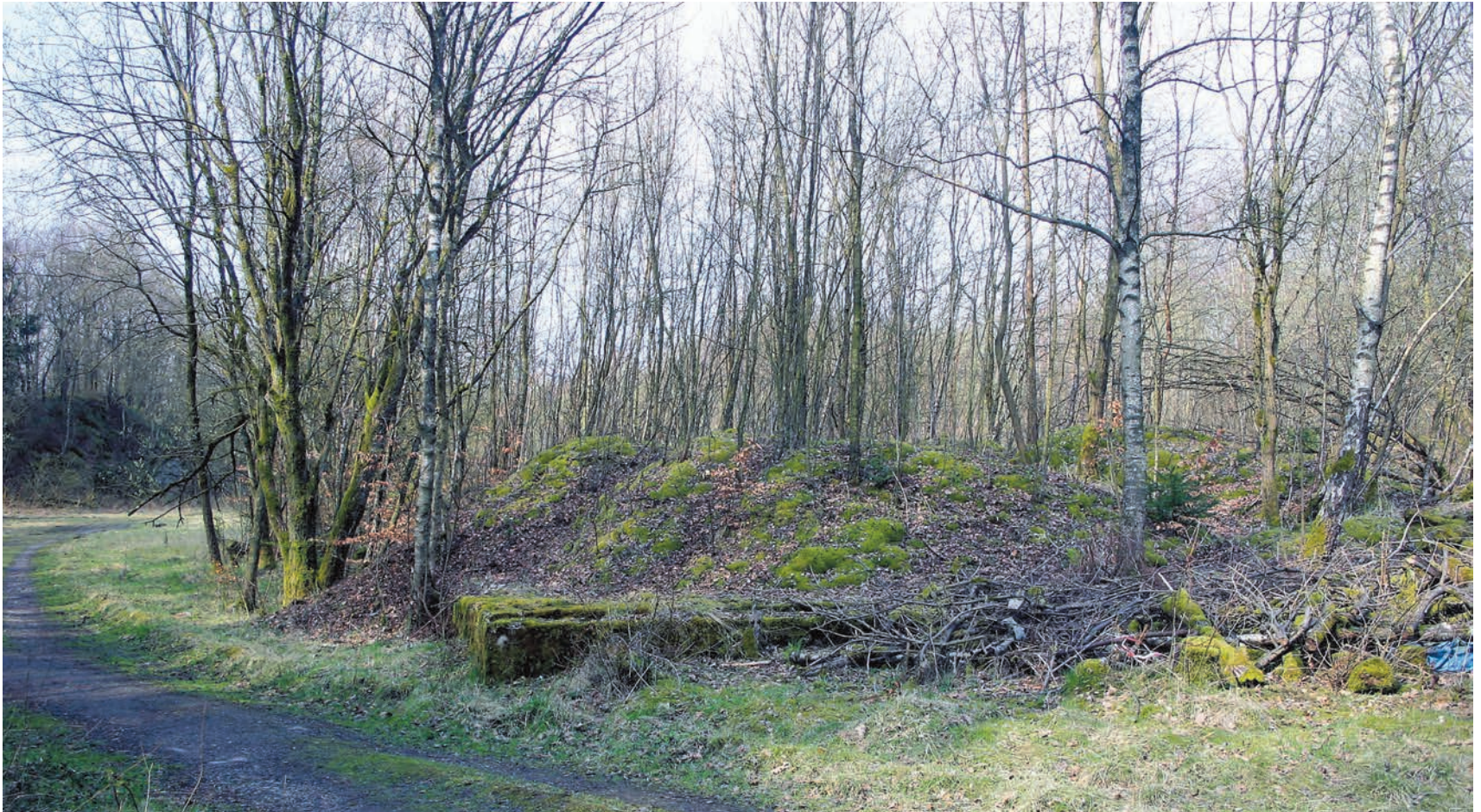
Abb. 11) Das Ika-Gelände im heutigen Zustand mit der südöstlichen Ecke der Betonplatte für die Traglufthalle.

ältere Lüdenscheider erinnern sich noch lebhaft an das Spektakel, das jetzt um die vierzig Jahre zurückliegt. Das Ika-Gelände ist heute verwildert. Übrig geblieben sind die Zufahrt, die Parkplätze und die riesige Betonplatte der Traglufthalle über dem im Steinbruch abgelagerten Müll. Das städtische Tiefbauamt hatte dort und anderswo auf dem Areal jahrelang große Mengen an Erdaushub abgelagert und nur zum Teil wieder abgefahren. Diese Schuttberge geben dem Gelände jetzt eine bizarre Gestalt, die mehr und mehr von Gebüsch und von Bäumen überwuchert wird. Die Spaziergänger, die dort ihre Hunde ausführen, sprechen nach wie vor vom Ika-Gelände, nicht vom Steinbruch, nicht von der Kippe und nicht von der Höh.