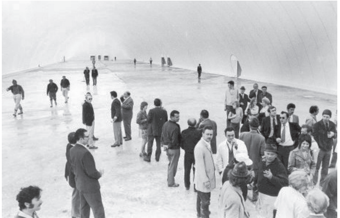
Abb. 4) Das Innere der Traglufthalle während des Richtfestes.

abstreifen“ und nach „Bauformen (suchen), die dem Menschen der Zukunft dienlich sind“. Ernst Weidehoff strebte mit den Ika-Präsentationen die Lösung von Kostenproblemen im Wohnungsbau an und erwartete familiengerechte Wohnungen zu einem vertretbaren Preis. Rudolf Doernach pries trotz zahlreicher offener bautechnischer Fragen die Vorteile von Kunststoffen beim Hausbau, wobei er besonders ihre Nachhaltigkeit im Blick auf den Umweltschutz hervorhob; die neuen Systeme stellten keine Wegwerf-Architektur dar; sie seien schallfest und brandstabil und zudem umweltfreundlich elektrisch beheizbar. Erneut skizzierte er seine Vorstellung von schwimmenden Städten aus Kunststoff und hielt dabei ein Plädoyer fürs Experimentieren.