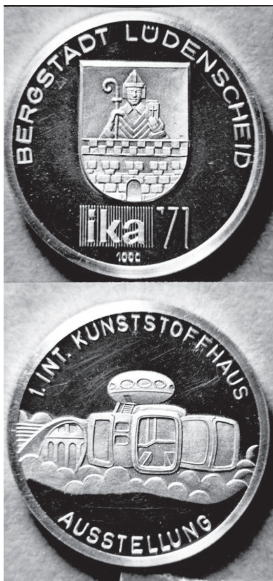
Abb. 6) Gedenkmedaille des Juweliers Hohage in der Silberausführung.

Der Kreis Lüdenscheid war mit einem Stand vertreten und ließ dort Prospekte verteilen. Die Stadt präsentierte sich in einem großen Pavillon unter einer Zelt Dachkonstruktion der Farbwerke Höchst. Dort warb sie mit einem großen Modell für ihre Planungen zur Stadtsanierung, was wenig mit Kunststoff zu tun hatte. In aller Eile war für die allgemeine Stadtwerbung ein Faltblatt in hoher Auflage gedruckt worden, das nicht gerade ansprechend geraten war. Gleich vier Mal prangte dort dasselbe Luftfoto mit der neuen Rahmedetalbrücke; auf den Autobahnanschluss war man natürlich stolz.