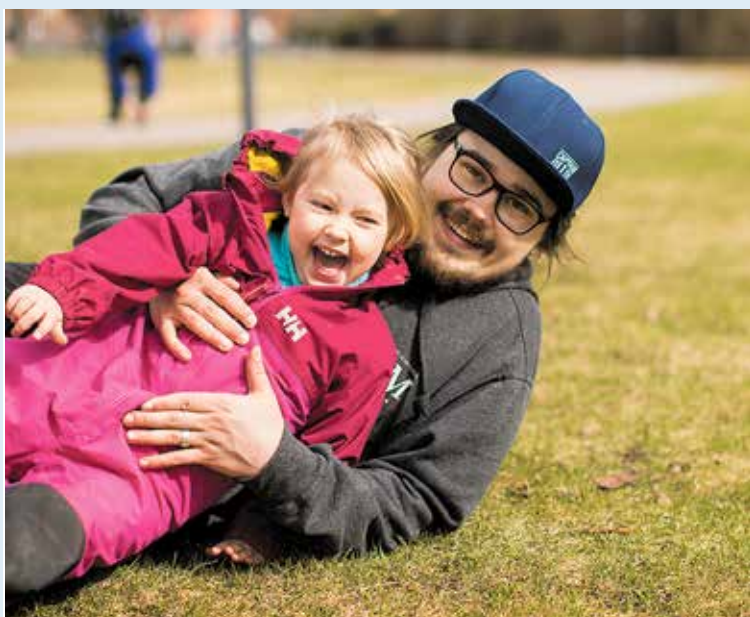
Yrittäjän ja perheenisän jaksamisessa keskeistä on oman elämän hallinta. Max Grönholmia elämäntaparemontti auttaa jaksamaan molemmissa rooleissa.

Nyt taas jaksaa. Ei ole enää työhön nukahtamisen fiilistä.